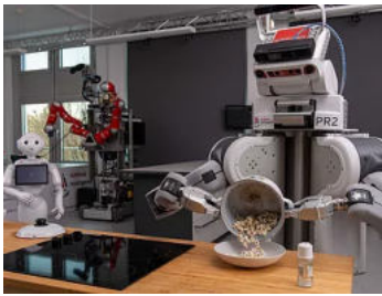
© Institute for Artificial Intelligence / Universität Bremen