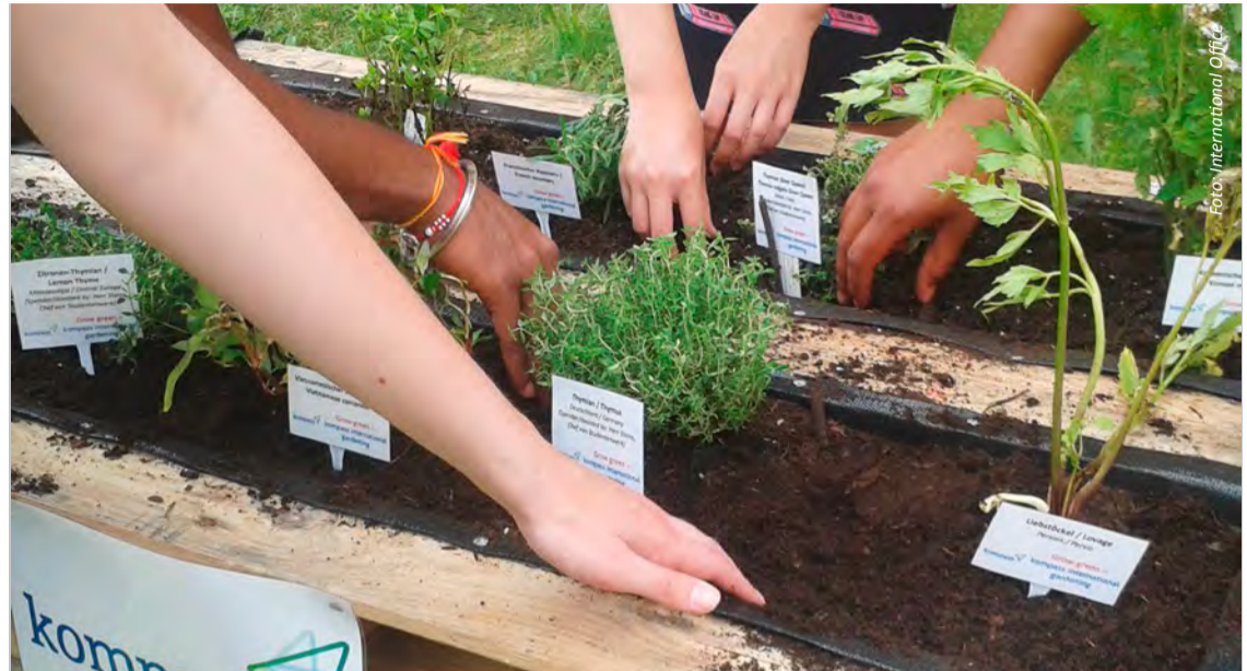
Internationale Studierende hatten Sehnsucht nach heimischen Kräutern: In den Palettenbeeten sollen nun Pak Choi und indischer Chili gedeihen.

Das Projekt „Grow Green international“ ist eine Kooperation zwischen dem kompass-Team des International Office der Universität Bremen und dem Studenten-