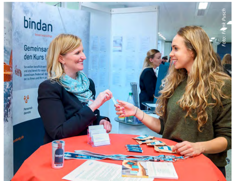
Bei der Praxisbörse der Uni Bremen treffen Arbeitgeber aus der Region auf Studierende sowie Absolventinnen und Absolventen.