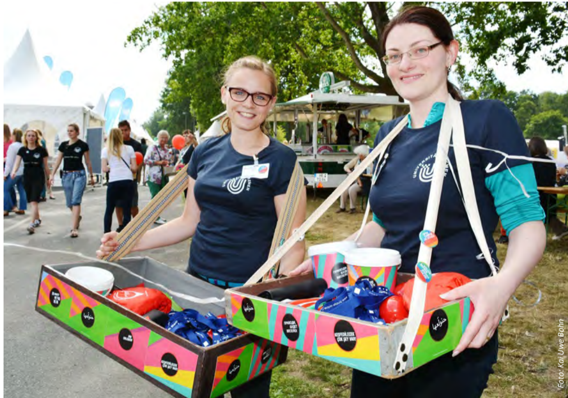
Buntes Treiben im Campus-Park: Die Fachbereiche haben sich Aktionen und Überraschungen ausgedacht, mit denen sie sich vorstellen.

Der OPEN CAMPUS findet alle zwei Jahre statt und ist an der Universität Bremen eine Tradition ge-